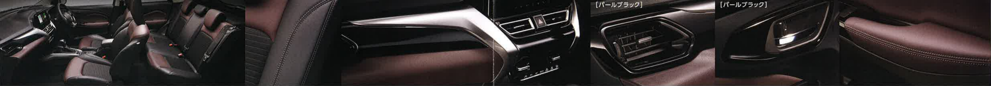
レザー調ドアアームレスト表皮[シルバーステッチ]