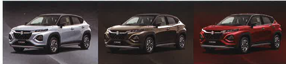
スプレンドッドシルバーパールメタリック ブラック2トーンルーフ(E85)