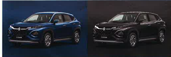
セレスティアルブルーパールメタリック(WBH)