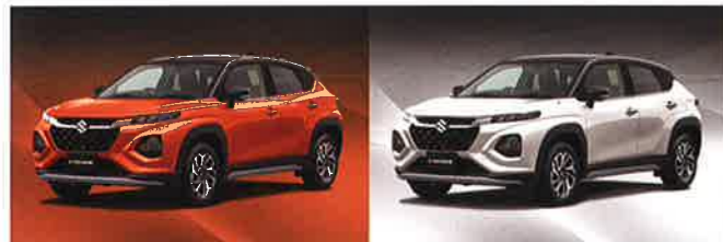
レーセントオレンジパールメタリック ブラック2トーンルーフ(E88)