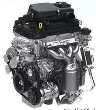
*エンジンイメージ